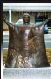
6 スカルダートの罠