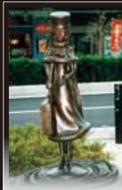
16 メーテルとの出会い