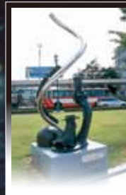
13 星野鉄郎とメーテル